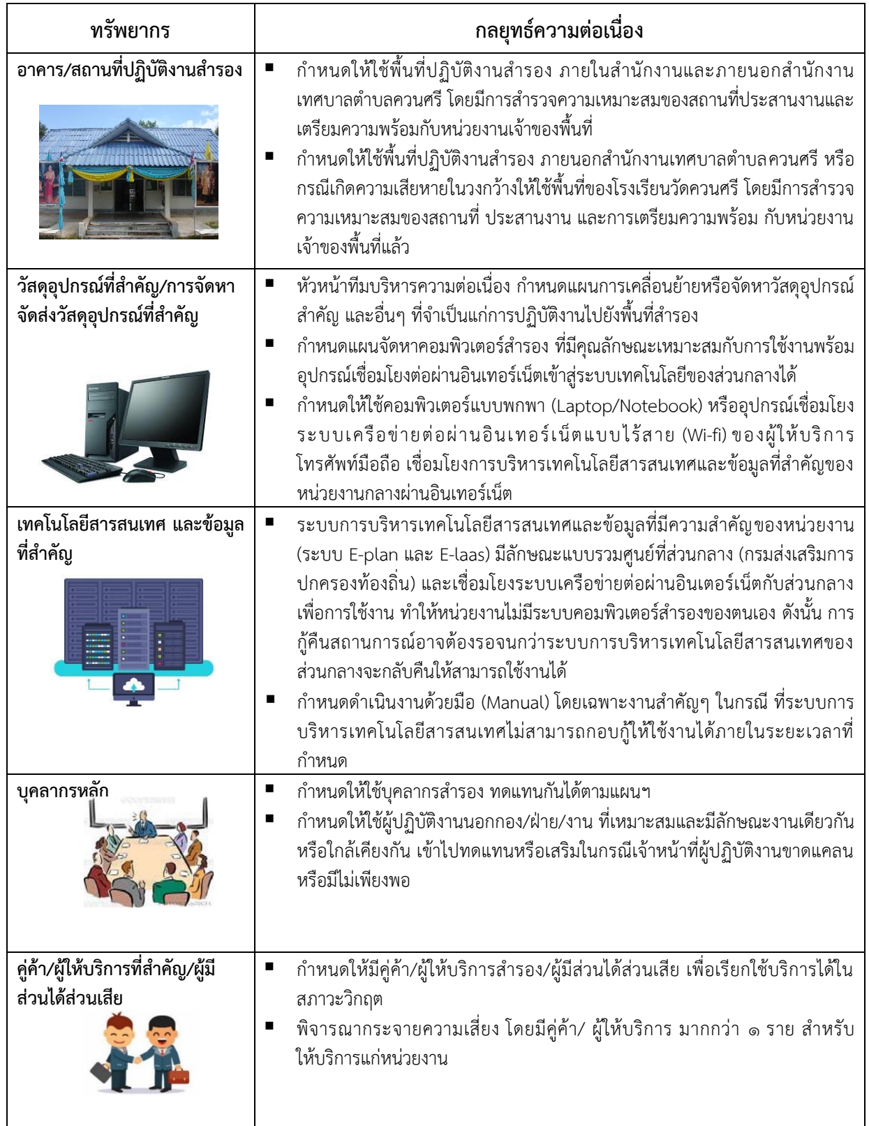
ตารางที่ ๒ กลยุทธ์ความต่อเนื่อง (Business Continuity Strategy)

กลยุทธ์ความต่อเนื่อง เป็นแนวทางในการจัดทาและบริหารจัดการทรัพยากรให้มีความพร้อมเมื่อเกิดสภาวะวิกฤต ซึ่งพิจารณาทรัพยากรใน ๕ ด้าน ดังตารางที่ ๒